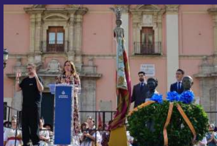
HOMENAJE | Aniversario del himno de la Comunitat Valenciana

VII Edición - PREMIOS ILUSTRES 2025 Reconocimiento a la labor de empresas, profesionales e instituciones a favor de la agricultura y deportes