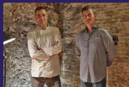
NUEVA CONCESIÓN restaurante de socios "Real Casino"