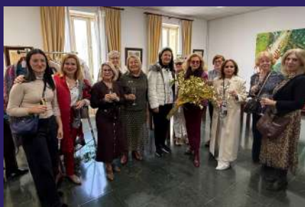
ROPERO SOLIDARIO TRÉBOL A beneficio de FEDER